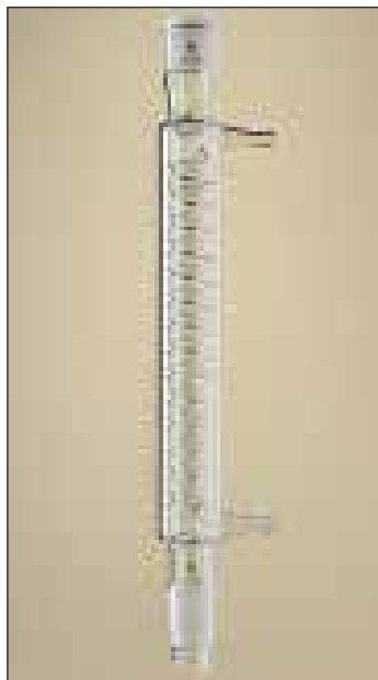
Spirál hűtő, felül tok, alul dugó csiszolattal