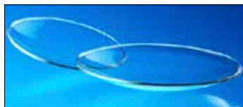
Óraüveg, olvasztott széllel