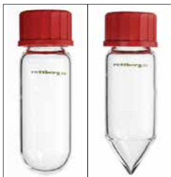
Centrifugacső, egységes, típuson belül azonos súllyal, gömbölyű illetve kúpos fenék, menetes kupakkal, (max. RZB:4000), (DIN 58 970)