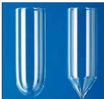
Centrifugacső, egységes, típuson belül azonos súllyal, gömbölyű illetve kúpos fenék, (max. RZB:4000), (DIN 58 970)